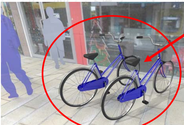
車両はイメージです。